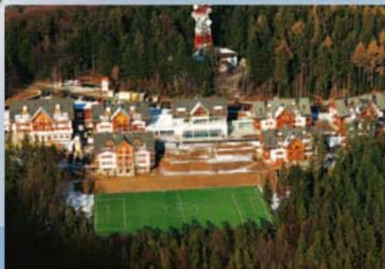
Center Bolfenk - le 12 min. oddaljen od centra Arena

Na nadmorski višini 1050 m, v neposredni bližini apartmajsko hotelskega naselja BOLFENK se nahaja še eno nogometno igrišče, predvsem primerno za višinske treninge, in sicer: